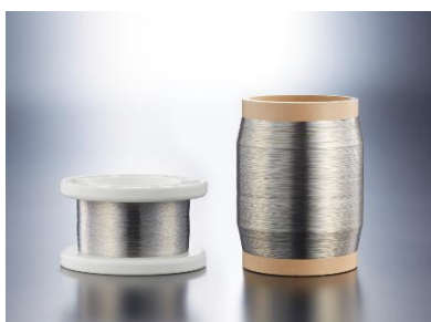
アモルファスワイヤ

今回の出展では、アモルファスワイヤの優れた特性と応用事例を紹介します。本展示会を通じて、北米地域の医療機器メーカーの方々にアモルファスワイヤならではの特性についてご理解を深めていただき、医療分野への更なる発展に貢献していきます。